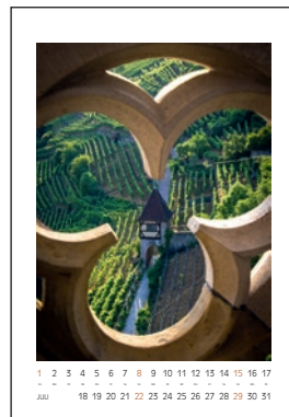
Blick von der Frauenkirche auf das Neckarhaldentörlé