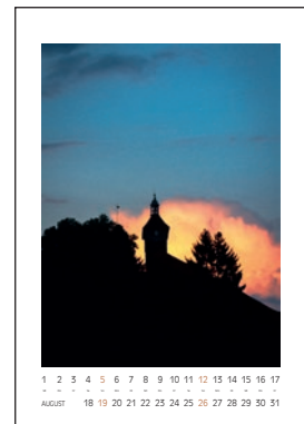
Hochwacht der Esslinger Burg