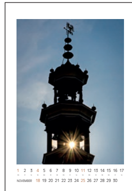
Glockenturm des Alten Rathauses