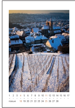
Blick von der Burg auf die Altstadt