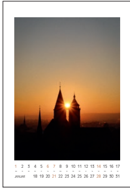
Stadtkirche St. Dionys