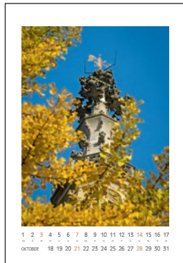
Turmspitze der Frauenkirche